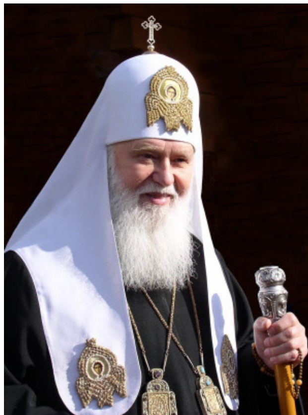
Se. Heiligkeit, Patriarch PHILARET Patriarch von Kiev und der ganzen Rus'-Ukraine

Im Februar des Jahres 2000 gelang es den Geistlichen der rum-orthodoxen Gemeinde, zusammen mit ihren Gemeindemitgliedern, mit ihrer Mutterkirche, dem Patriarchat von Antiochien und dem ganzen Orient, eine einvernehmliche Lösung zu finden, um wieder in den Schoß ihrer antiochenischen Mutterkirche zurückkehren zu können.