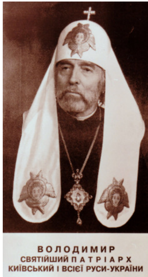
Se. Heiligkeit, Patriarch VOLODYMYR Patriarch von Kiev und der ganzen Rus'-Ukraine

Nach dem tragischen Tod Se. Heiligkeit, Patriarch VOLODYMYR, am 14. Juli desselben Jahres, wurde auf dem Landeskonzil der Ukrainischen Orthodoxen Kirche des Kiever Patriarchates, das für den Zeitraum vom 19. bis 22. Oktober des Jahres 1995 nach Kiev einberufenen wurde, der bisherige Stellvertreter des Patriarchen, Se. Seligkeit, Metropolitan PHILARET von Kiev, zum neuen Patriarchen gewählt. Die Wahl erfolgte in freier und geheimer Abstimmung. Von den stimmberechtigten 173 Delegierten des Landeskonzils erhielt Metropolitan PHILARET 160 Stimmen, 4 Teilnehmer stimmten gegen seine Wahl und 9 Teilnehmer enthielten sich einer Stimmabgabe.